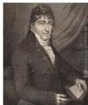
Winterbloemen Willem Bilderdijk