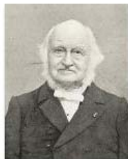
Camera Obscura Nicolaas Beets